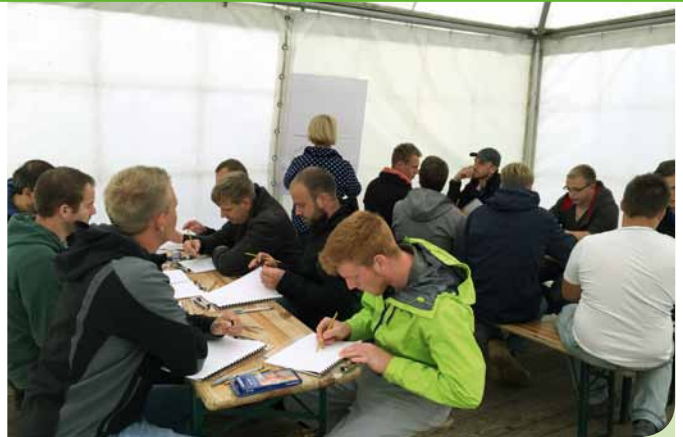
Die jungen Landschaftsgärtner waren aus ganz Deutschland nach Rathenow angereist, um sich weiter fit machen zu lassen.