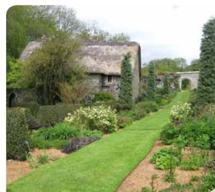
Endlos lang, zeitlos schön ... „Very British“.

mann. Genauso gut kam auch das Rahmenprogramm an. Der Dartmoor National Park hatte neben gärtnerischen Highlights auch ein Gefängnis zu bieten, bei dem die jungen Landschaftsgärtner Schauriges und Kurioses erfuhren. Sportlich ging es in Newqay zu. „An diesem Küstenabschnitt konnten wir einen eintägigen Surferlehrgang absolvieren. Super Erfahrung!“, so ein Teilnehmer.