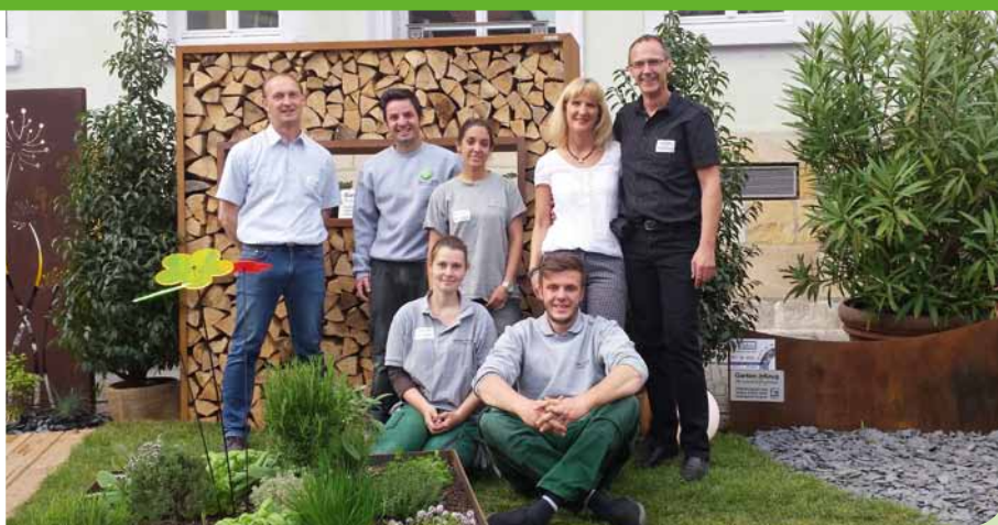
„Esslinger Frühling“ – mit spanischer Beteiligung.

Dass Integration auch gelingen kann, zeigt das Beispiel der beiden jungen Spanier, die seit Juli 2014 bei der Firma Garten Krug GmbH in Kirchheim unter Teck ihre Ausbildung zum Landschaftsgärtner machen. So wurden die jungen Leute von Anfang an durch VHS-Kurse beim Erlernen der deutschen Sprache unterstützt. Auch bei der Suche und Einrichtung einer kleinen Wohnung, bei allen Behördengängen und bei Freizeitaktivitäten wurde ihnen ganz aktiv geholfen. Im betrieblichen Ablauf wird Wert darauf gelegt, dass die jungen Spanier von allen Kollegen gut aufgenommen und genauso gefördert und gefordert werden wie die übrigen Auszubildenden auch. Auch für Fragen und Probleme privater Art oder ein persönliches Gespräch stehen das