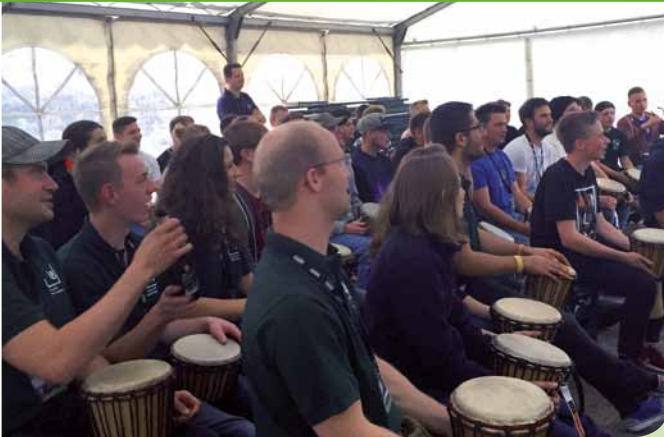
Action zum Auftakt: das besondere Programm des GALABAU CAMP riss von Beginn an alle Teilnehmer (lautstark) mit.