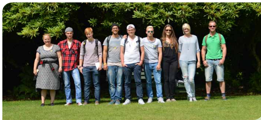
Grüner wird's nicht – wie könnte es in England anders sein.

Die neuntägige Fachexkursion ist alles andere als ein gemütlicher Urlaub. Jeden