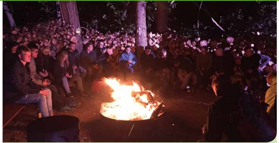
Netzwerken kam nicht zu kurz – die Brandenburger Natur bot die perfekte Kulisse, die Stimmung war top.

Seien Sie gespannt, denn aufgrund des großen Erfolgs und des hohen Zuspruchs der Teilnehmer wird das GALABAU CAMP auch 2016 weitergehen, mit Angeboten, die einen echten beruflichen und persön-