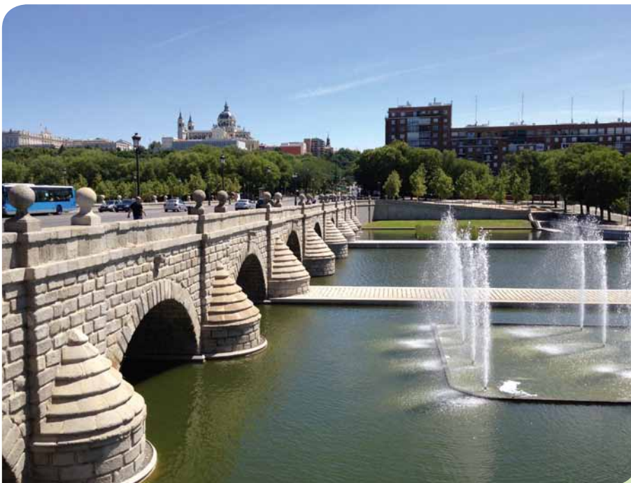
VGL NRW: 2015 für die spanischen Jugendlichen vor Ort in Madrid.