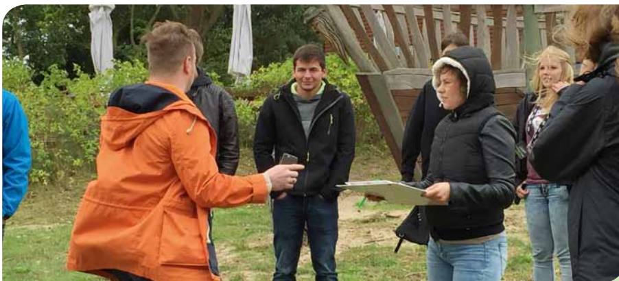
„Raus und machen“ lautete eine Devise der besonderen Workshops.

Die Gruppen starteten auf dem idyllisch gelegenen Campingplatz am Steckelsdorfer See im brandenburgischen Rathenow mit Drums in das Wochenende. Die besondere Mischung aus Weiterbildung mit Workshops, Action, Spaß und nicht zuletzt Netzwerken war von Beginn an für jeden Teilnehmer spür- und hörbar! >>>