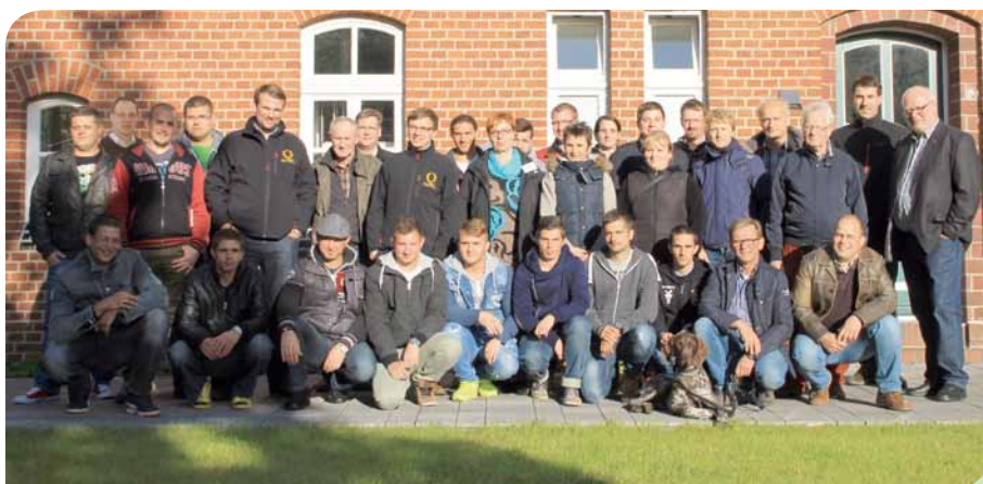
Potentieller Nachwuchs aus Ungarn: interessierte Jugendliche in Papenburg.

Die ausländischen Auszubildenden benötigen zur Bewältigung der alltäglichen Fragen rund um Wohnen, Mobilität und Geld mehr Betreuung durch den Betrieb. Wer ausländische Auszubildende ausbilden will, sollte sich im Klaren sein, dass er zunächst durchaus mehr Zeit und Geld investieren muss als in einen durchschnittlichen