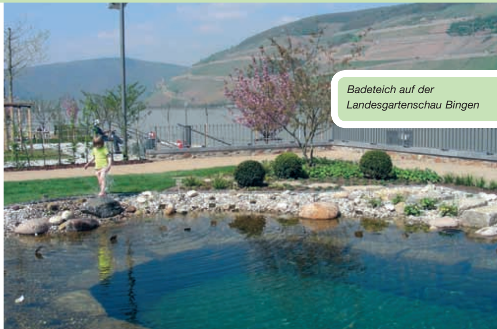
Badeteich auf der Landesgartenschau Bingen

gischer Wasserreinigung gewünscht wird – diese Technologie wird auch im Kommunalbereich angewandt. Beide Extreme sind möglich, die dazu nötige Technologie steht zur Verfügung. Innerhalb dieser Bandbreite gibt es natürlich Mischformen. Dadurch konnten die verschiedensten Bauweisen entwickelt werden: