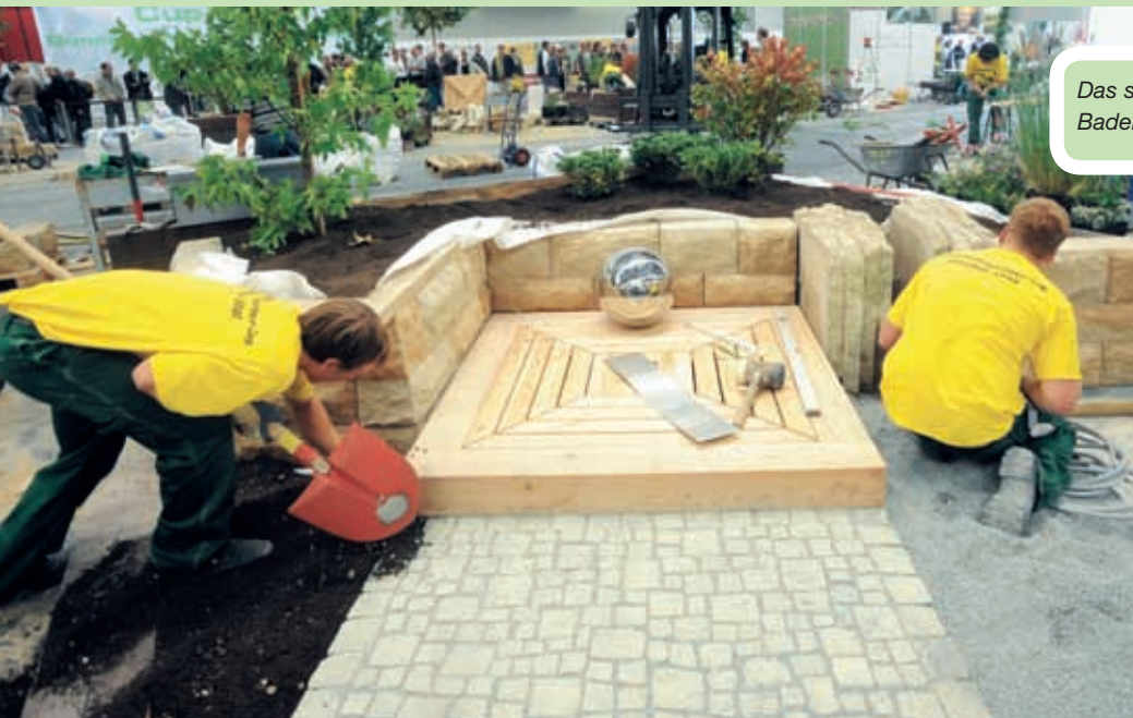
Das spätere Siegerteam aus Baden-Württemberg bei der Arbeit