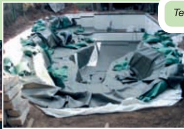
Teichfolie PVC 1,50 mm stark